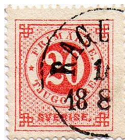
Nr 22 röd

cinnober utom vid en tryckupplaga 1875 då man använde en flyktig lätt föränderlig tjärfärg, som under ljusets inverkan förändrades till blekorange. Dessa bleka märken återkallades och blev under tiden till december 1876 övertryckta. Den bleka nyansen finns angiven som f) blekorange . Färgstyrkan är mycket svag och anges i handböckerna som (1), vilket är den svagaste färgstyrkan.