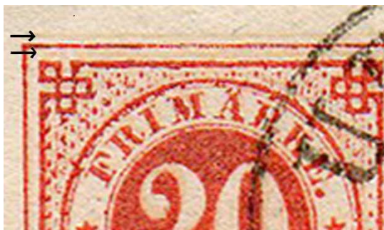
Förstoring av 20 på 20 öre ringtyp

Ramen från den tidigare tryckningen syns vid sidan av ramen på övertryckningen, i det här fallet till vänster om ramen och under den nedre raden. På märket ovan av nr 23 ser man svagt gula extra linjer ovanför och under den övre ramen.