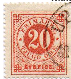
Nr 23 20 på 20 öre