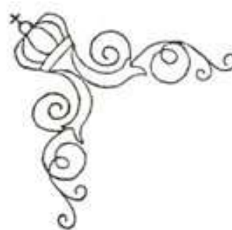
Typ II: 1872 – 1880

Mellan 1872 – 1880 användes ett marginalvattenmärke av typ II. Under 1880 – 1886 användes ett tredje vattenmärke som är snarlikt typ II. I sällsynta fall kom papperet att placeras så förskjutet i pressen att delar av marginalvattenmärket återfinns på något eller några frimärken. En bild på detta återfinns i 1961 års handbok (ref. 1).