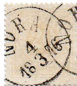
Nr 22f blekorange