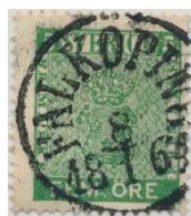
Facit 7a 1