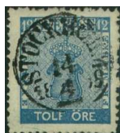
Facit 9c 1

12 öre Vapentyp har betydligt fler nyanser än de övriga valörerna och dessutom flera varianter med olika tandningsverktyg!