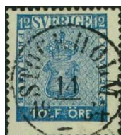
Facit 9c 2