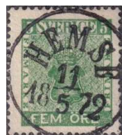
Facit 7a 2