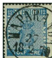
Facit 9c 3