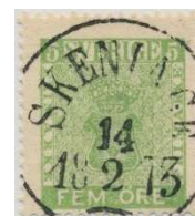
Facit 7f 2

12 öre Vapentyp har betydligt fler nyanser än de övriga valörerna och dessutom flera varianter med olika tandningsverktyg!