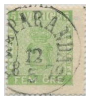
Facit 7f 1